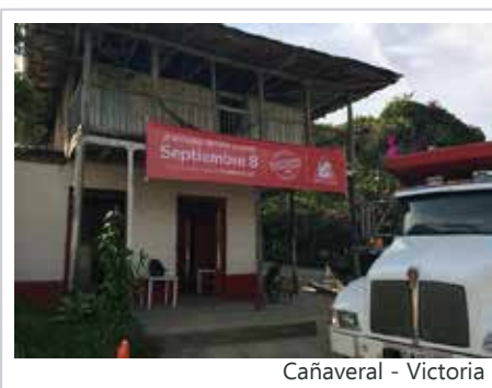
Cañaveral - Victoria