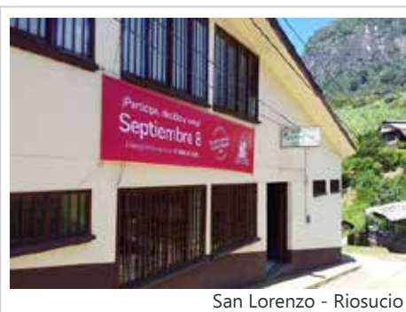
San Lorenzo - Riosucio