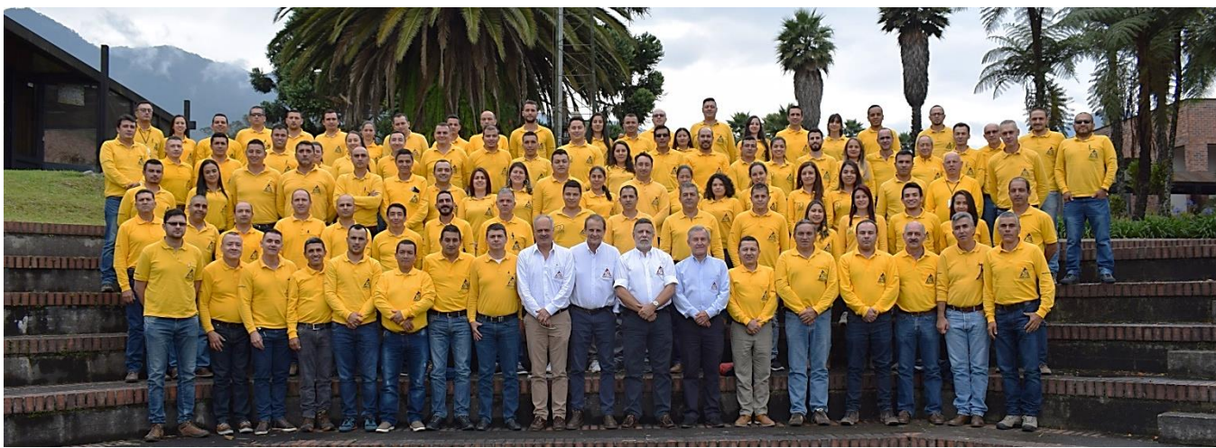
Foto: Manizales, Recinto del Pensamiento

Destacó el Gerente Técnico de la FNC en Encuentro Departamental