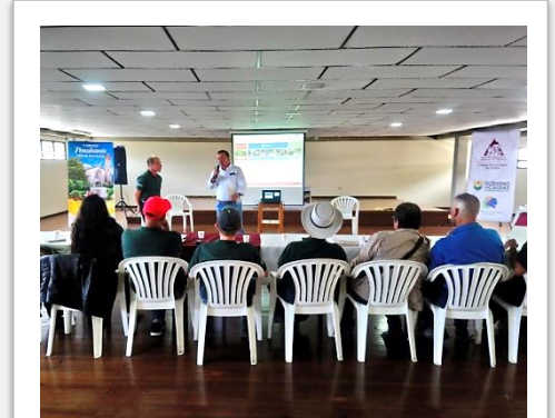
Sesión del Comité Municipal de Cafeteros de Pensilvania con los cuatro candidatos a la Alcaldía.

Los 24 Comités Municipales de Cafeteros de Caldas adelantan el ciclo de sesiones especiales con los candidatos a la Alcaldía en un ejercicio tradicional en año de elecciones populares con el objetivo de destacar ante los futuros gobernantes la trascendencia de la caficultura y de procurar por el bienestar al caficultor y su familia. Comités Municipales de Cafeteros como los de Aguadas, Samaná, Anserma, Pensilvania, Belalcázar, Palestina, Viterbo y Risaralda ya hicieron estos encuentros que son liderados por el Presidente de cada Comité, donde los representantes cafeteros empoderados de su vocería interceden por sus comunidades cafeteras. Además, presentan los programas y proyectos que el Comité ejecuta en su municipio en los ejes Productivo, Infraestructura, Educación, Equidad de Género y Medio Ambiente. Los aspirantes han expresado el carácter estratégico del trabajo con el Comité de Cafeteros para el progreso del municipio.