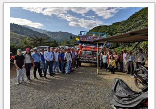
Jornada El Agricultor Ideal de los Almacenes del Café en la Vereda El Topacio, de Pácora.

El área comercial del Comité de Cafeteros de Caldas está realizando las jornadas El Agricultor Ideal en las que convoca a los clientes de los Almacenes del Café para llevarles conocimientos y presentarles la diversidad de insumos y maquinaria en los puntos de venta no solo para los caficultores sino para los agricultores en general. Con base en los Días de Campo del Servicio de Extensión, los asistentes recorren seis estaciones a cargo del área Comercial del Comité y sus proveedores. Esta es una nueva estrategia comercial con la cual también se busca posicionar los 31 Almacenes del Café en 24 municipios y 6 corregimientos de Caldas donde se convierten además en reguladores de precios. El Agricultor Ideal comenzó en mayo del presente año y a la fecha se han efectuado cinco jornadas. Las siguientes son en Anserma, Florencia (Samaná) y Villamaría. Posteriormente se organizarán para Manizales y el oriente del departamento.